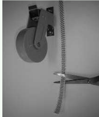
Knip het band \pm 25 cm voorbij de bandopwinder af.