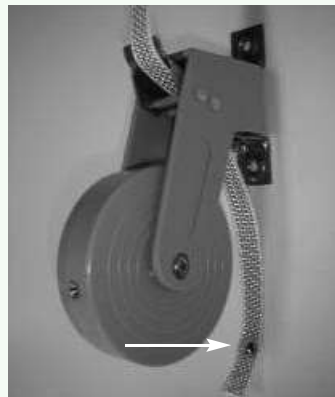
Plaats het schroefje door het in geknipte band.