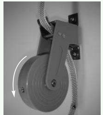
Draai de veer voldoende op spanning. Houdt deze spoel goed vast i.v.m. de grote veerspanning.