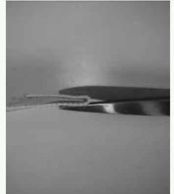
Vouw het uiteinde dubbel en knip het uiteinde van het band in.