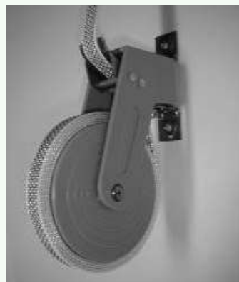
Laat nu rustig de veer afrollen.