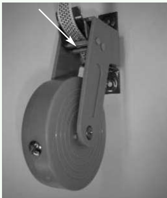
Voer het band over de 2 stuks cilinders door de rem.