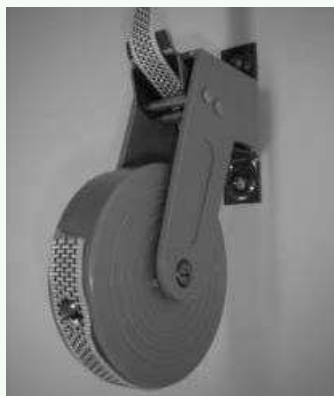
Schroef nu het schroefje met het band op de spoel.