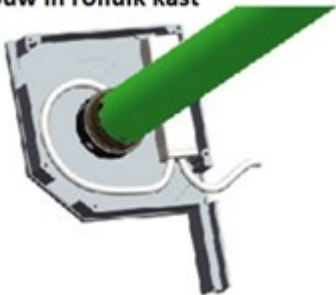
inbouw in rolluik kast

draad naar beneden zodat heen (regen) water in de behuizing kan komen